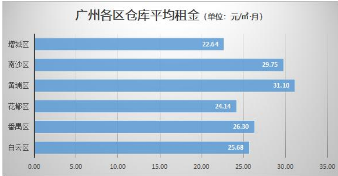
图 5 2018 年 11 月广州各区仓库平均租金

广州市各区平均租金约为 27.54 元/㎡·月，相较于全国其他一线城市，广州仓库平均租金处于中等偏上水平，租金水平仅低于北京、上海、深圳、苏州、杭州几大城市。