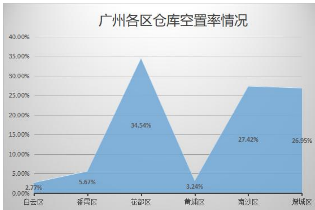
图3 2018年11月广州各市区仓库空置率情况

2018年11月，广州各区物联云仓在线仓库可租面积为1,206,510平方米(不包含在建仓)，仓库空置率在2.7%-34.6%之间。空置率地区之间差异较大，其中花都区空置率最高，达到34.54%；黄埔区、白云区空置率较低，分别为3.24%、2.77%。