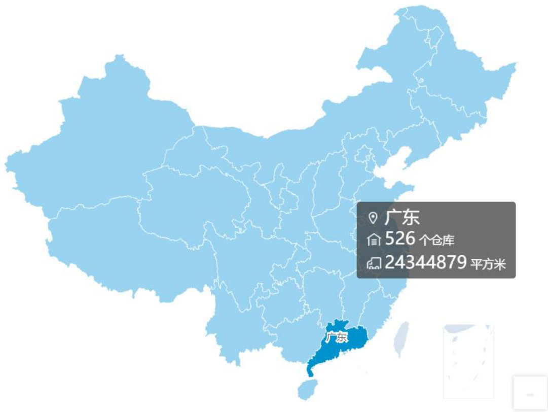
图 1 物联云仓仓库云图

物联云仓《2018 年广州仓库租赁行业现状与仓储物流产业发展分析报告》挑选黄埔区、增城区、白云区、花都区、番禺区、南沙区等仓库主要分布地区普通仓进行分析，希望对大家了解市场行情、租仓选仓有一定参考价值。