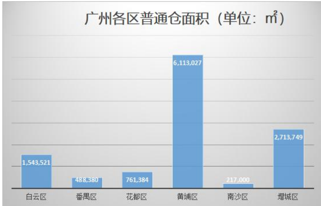
图 2 2018 年 11 月物联云仓在线广州各区普通仓面积 (单位: m 2 )

黄埔区 坐拥华南第一大港--广州港，以工业为主，是世界五百强企业集中区域，重点围绕电子信息、生物制药与健康、快消品、日用品、食品、智能装备和机器人、汽车和零部件、精细化工、新能源和节能环保等高端高质高新产业发展，地理位置得天独厚，目前在线仓库面积远超其他区；